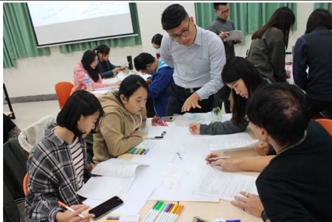
講師引導討論心智圖關鍵