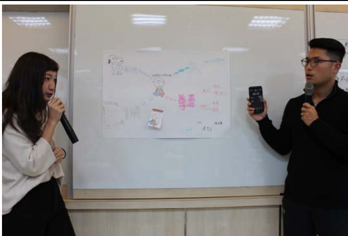
同學挑戰使用 PREP 一分鐘說出論點