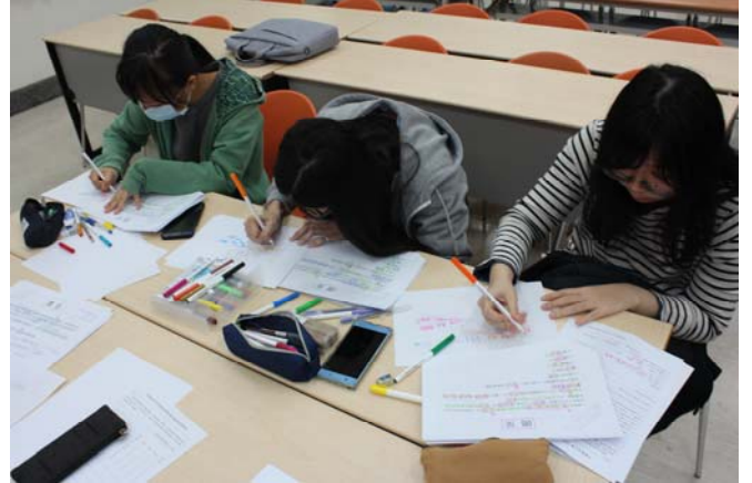
同學以一篇文章-喝茶，練習整理為心智圖