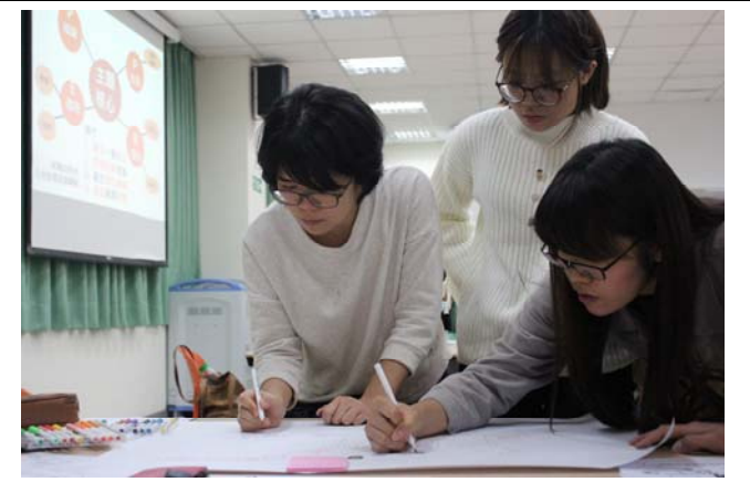
團體分組討論議題