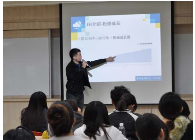
說明粉絲頁人數變化的重大事件。